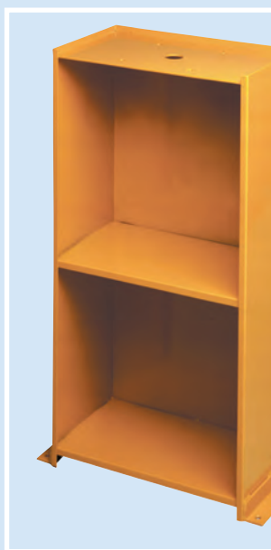
MS - Mobiletto di supporto MS - Support cabinet