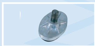
PA - Piatto appoggio PA - Supporting plate