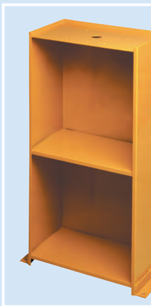
MS - Mobiletto di supporto MS - Support cabinet