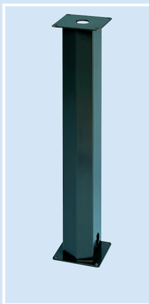
CS - Colonna CS - Support pillar